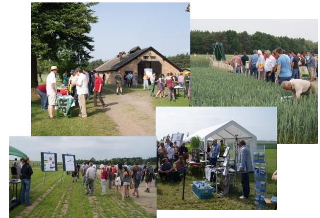
Impressionen vom PIT 2014