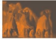
Landschaft im Wandel

Landschaften werden oft mit Erholung, Freizeit und Natur assoziiert. Dass sie aber unsere wichtigsten Lieferanten für Rohstoffe sind, bleibt vielfach im Hintergrund.