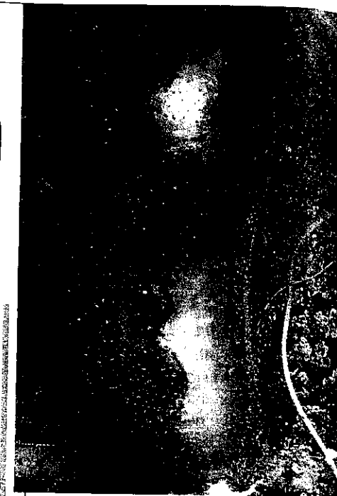
1 Deformierte Gurkenfrucht (Sorte 'Berdine') nach ZYMV-Infektion

ZYMV-infizierte Pflanzen zeigten in allen Untersuchungsjahren die deutlichsten Merkmale einer Viruserkrankung: Hier wurden Blattdeformierungen und Fruchtdeformierungen in