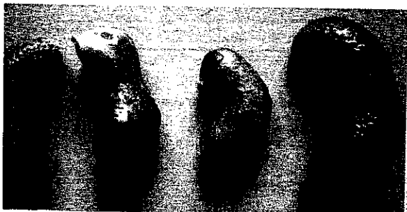
2 Deformierte und nekrotische Gurkenfrüchte der Sorte 'Melody' nach Mischinfektion von ZYMV und Watermelon mosaic virus (WMV)

Durch die Züchtung entstand eine Vielzahl neuer Sorten von Zier- und Speisekürbissen mit sehr variablen Formen und Färbungen von Blättern und Früchten. Häufig sind genetisch bedingte Blattpanaschierungen und Fruchtdeformationen; kaum von Symptomen einer Viruserkrankung zu unterscheiden. Dadurch werden viruskranke Pflanzen im Bestand häufig übersehen. C.M.