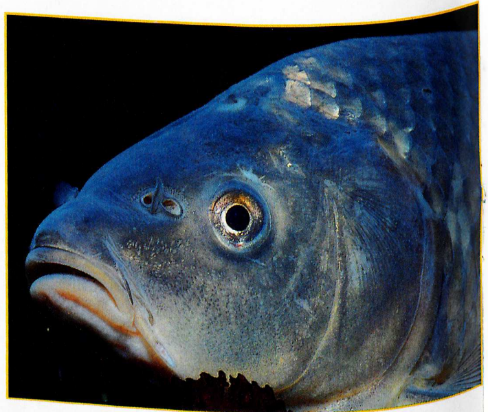
Da bin ich. Verzeihen Sie meinen etwas entgeisterten Gesichtsausdruck, aber schließlich werde ich nicht alle Tage fotografiert.