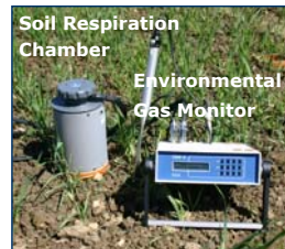
Gerät zur Messung der Bodenatmung