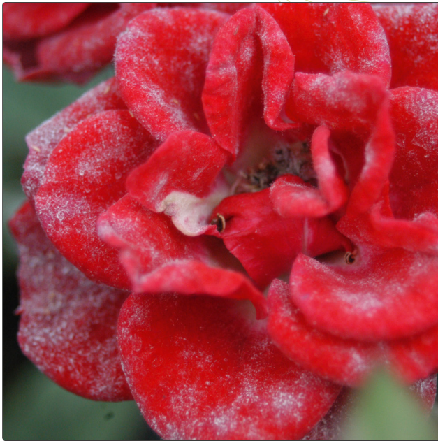
Abbildung 5 Echter Mehltau an Rosen