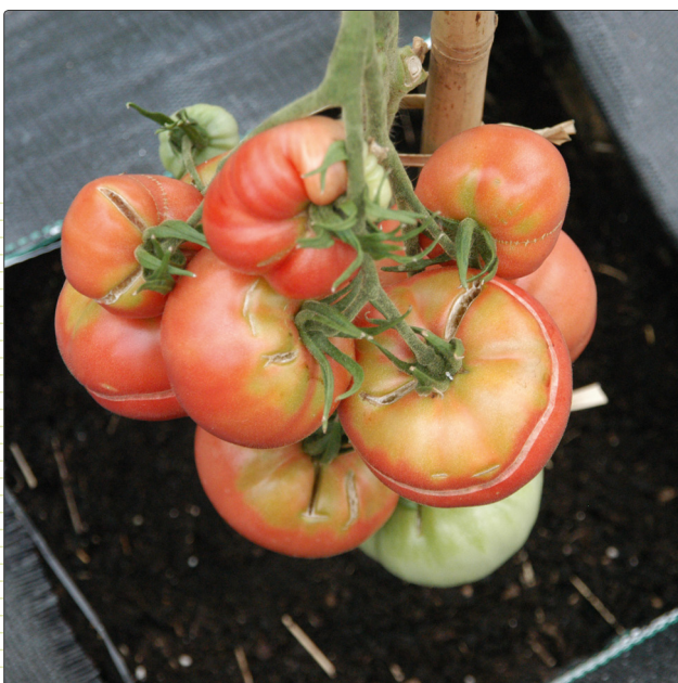
Abbildung 1 Durch unausgewogene Nährstoff- und Wasserversorgung bedingtes Aufplatzen der Früchte

Im Freizeitgartenbereich sind 60 bis 70 Prozent der Schadensursachen abiotischen Ursprungs. Die Ursachen sind vor allem Stressfaktoren wie Sonne, Hitze, Trockenheit und kalte Winter. Die Taubildung hat beispielsweise in