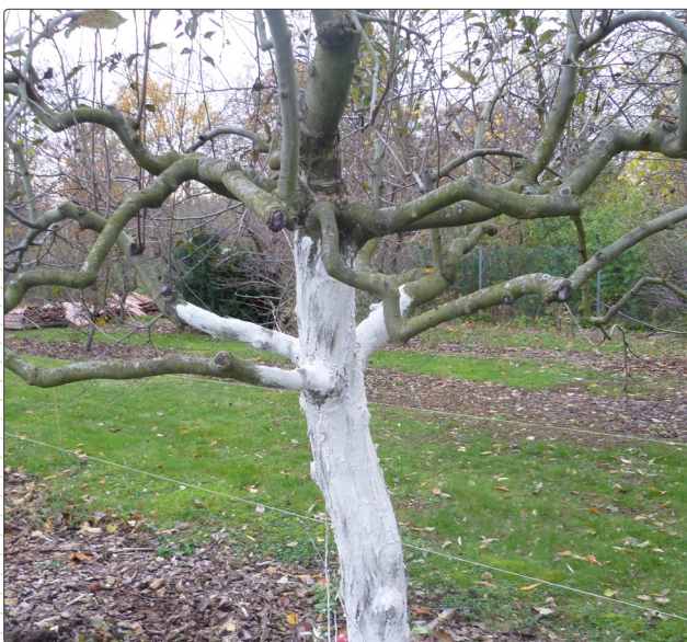
Abbildung 3 Kalken von Obstgehölzen im Winter