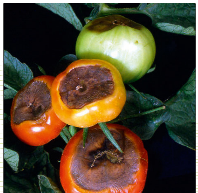
Abbildung 2 Blütenendfäule an Tomaten