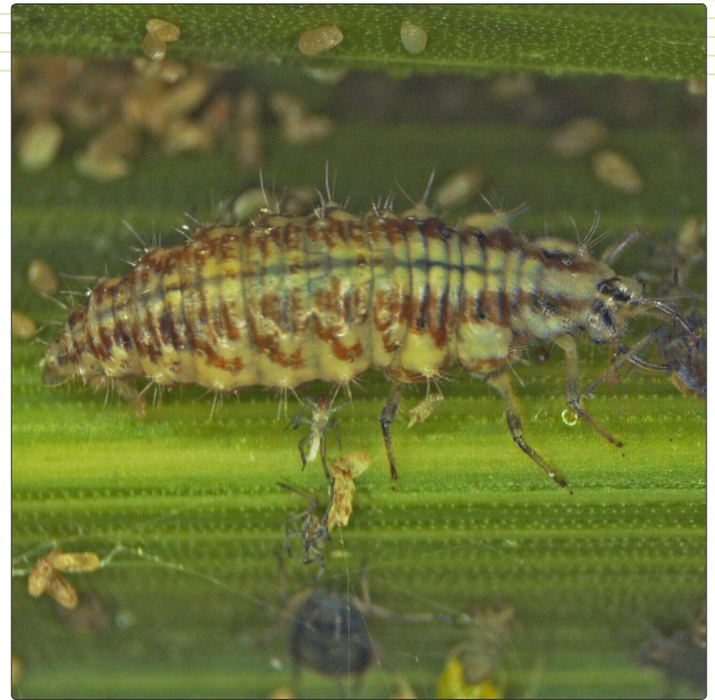
Abbildung 6 Für Florfliegenlarven sind Blattläuse eine wichtige Nahrungsquelle.