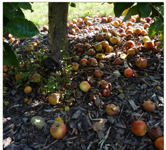
Abbildung 4 Bei Fruchtmonilia (Fruchtfäule) sollten Sie faules Obst und Fruchtmumien von Bäumen, Dächern und dem Boden entfernen.