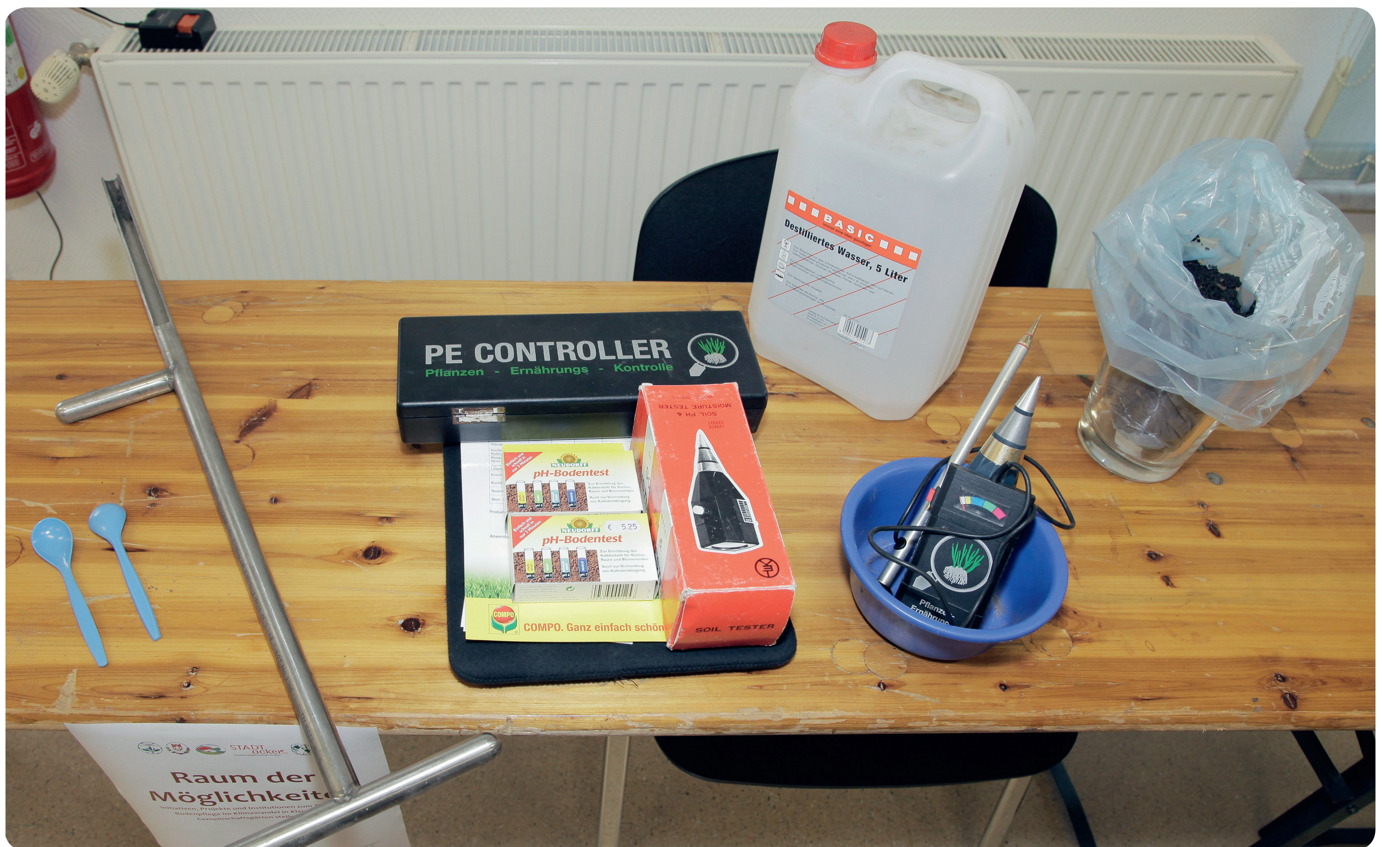
Werkzeuge wie der Erdbohrstock, destilliertes Wasser und Messinstrumente für Bodenanalysen (Foto: Sandra Bergemann).

einer Bodentiefe von 20-30 cm entnehmen sollten. Landwirtschaftskammern und verschiedene Institute bieten einen Bodenuntersuchungs-Service für Haus- und Kleingartenbesitzer*innen an. Dort erhalten Sie auch weitere Informationen zur richtigen Bodenentnahme. In der Regel kostet eine Bodenuntersuchung zwischen 30 und 50 Euro. Bei Standardanalysen erhalten Sie Angaben zu Hauptnährstoffen, Bodenart, Humusgehalt sowie pH-Wert verbunden mit einer Düngeempfehlung.