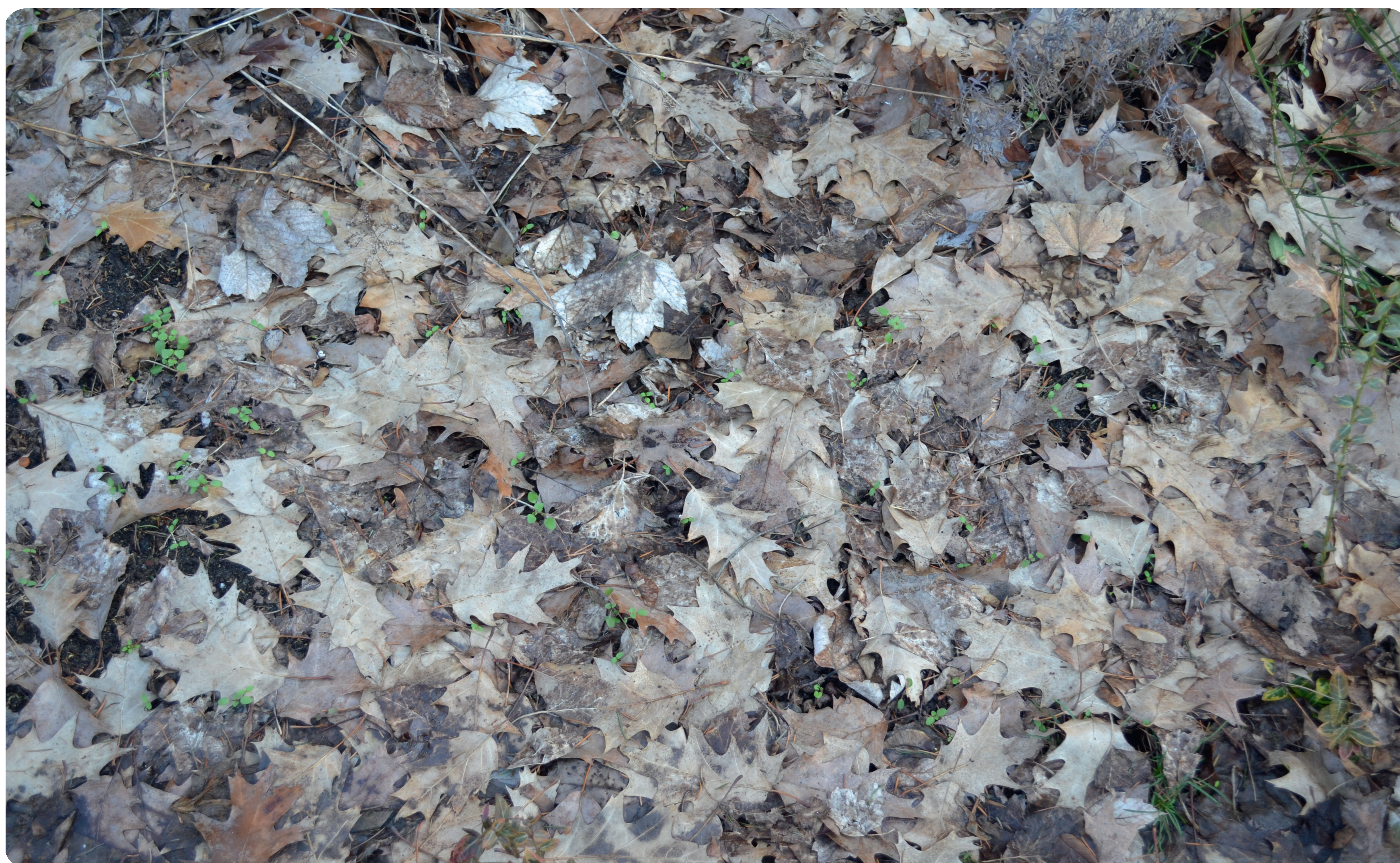
Mulchschicht aus Herbstlaub. Sie sollte vor dem Intensivaustrieb der angebauten Kulturen entfernt werden.

Durch den Schutz des Bodens können Sie viel für das Gedeihen Ihres Gartens tun!