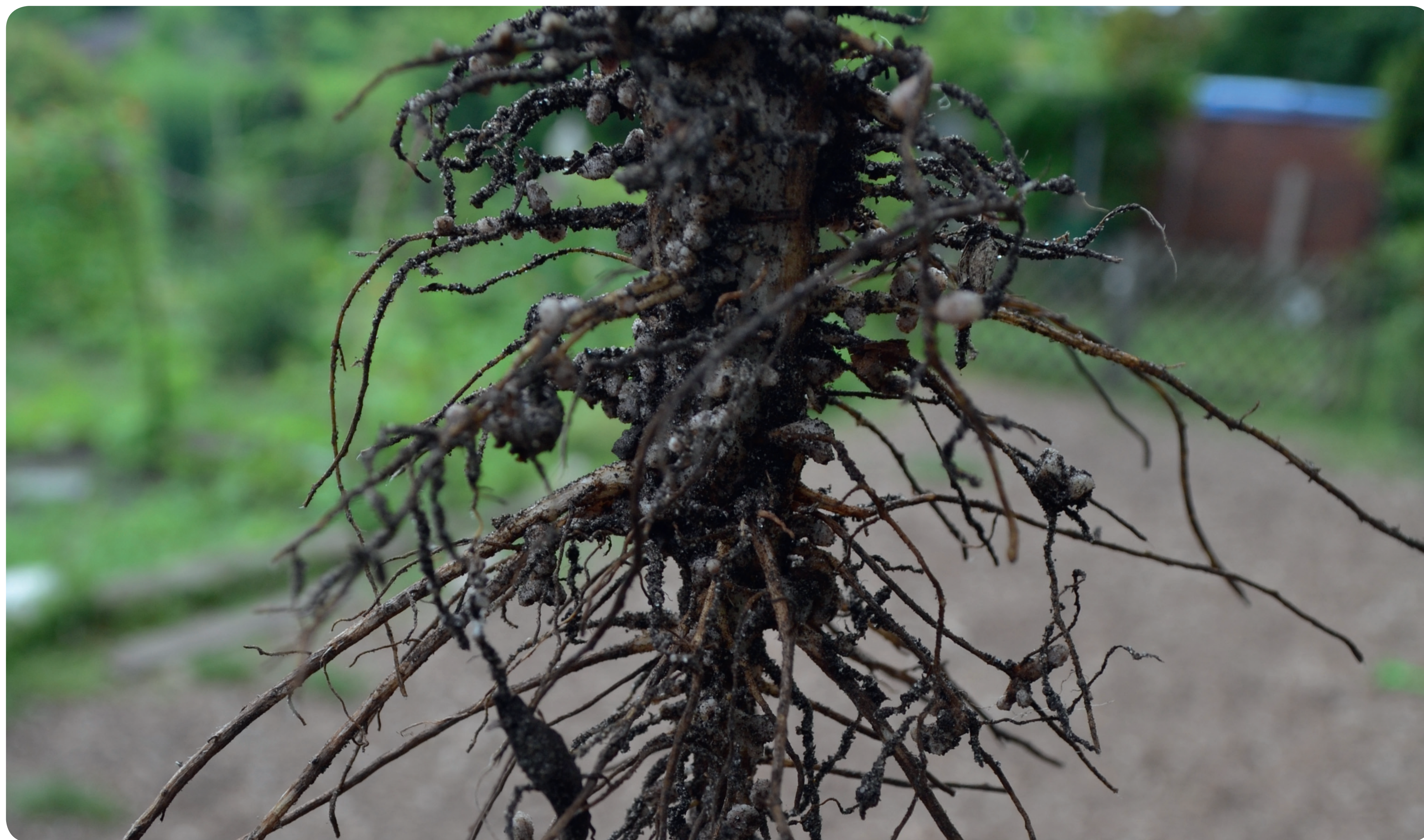
Knöllchenbakterien an den Wurzeln von Leguminosen versorgen die Pflanzen mit Stickstoff aus der Bodenluft. Als Gründüngung verwendet reichern die Pflanzenrückstände den Boden mit dem wertvollen Nährstoff an.

Das Bodenleben braucht organisches Material und Wasser als Nahrung und will möglichst ungestört bleiben. Kompostierung , eine ganzjährige Bodenbedeckung durch Mulchen und Gründüngung sowie Mischkulturen und ausgeglichene Fruchtfolgen sind dabei sehr zuträglich. Umgraben stört die natürlich gewachsene Struktur des Bodens. Stattdessen sollte der Boden oberflächlich gelockert werden.