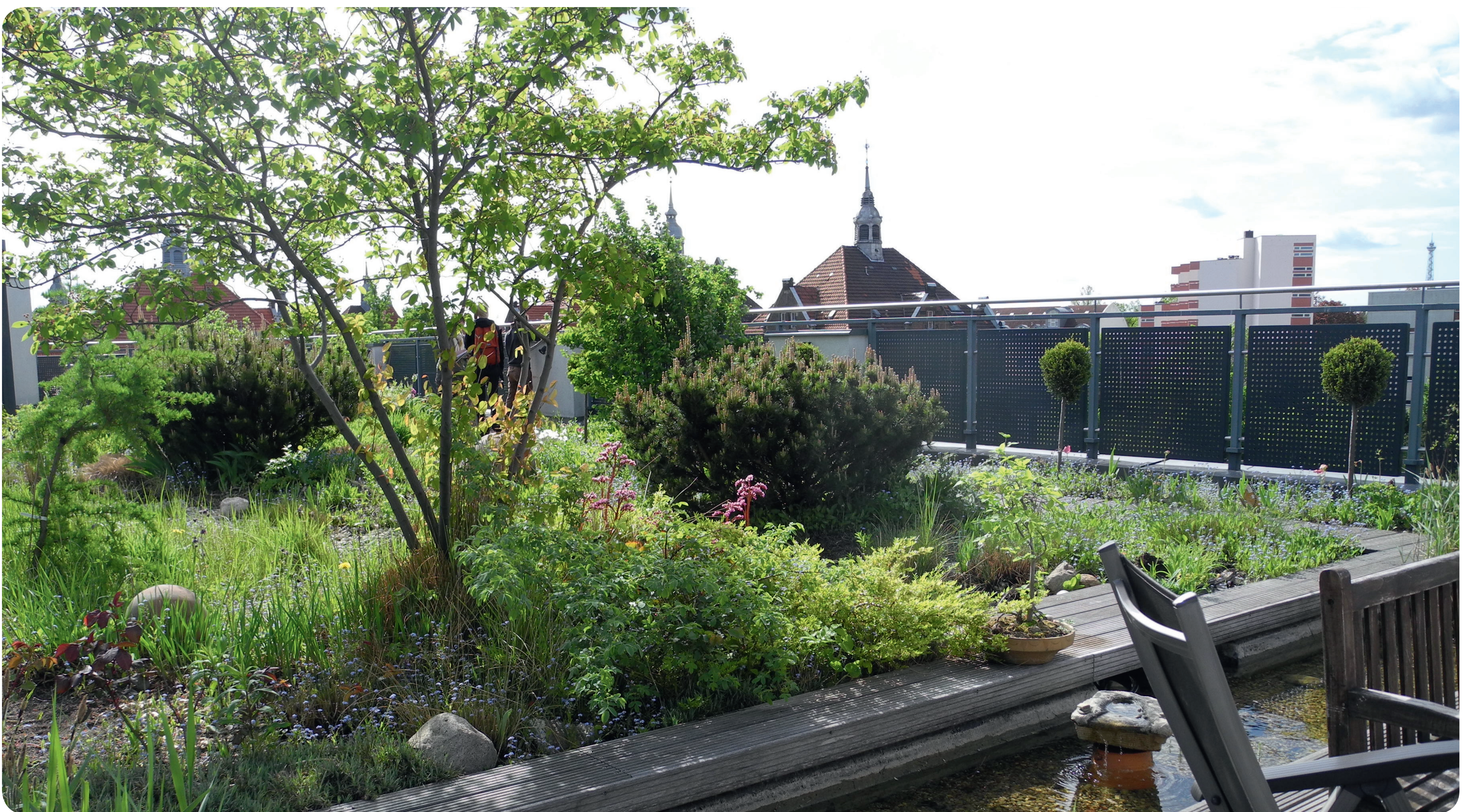
Dachbegrünung auf der Wigmann-Klinik in Berlin. Der Garten wird intensiv zu Therapiezwecken genutzt und ist ein idealer, geschützter Erholungsort.

Damit Gründächer und Fassaden diese Funktionen erfüllen können, müssen sie fachgerecht angelegt sein. Lassen Sie sich von Expert*innen des Garten- und Landschaftsbaus beraten!