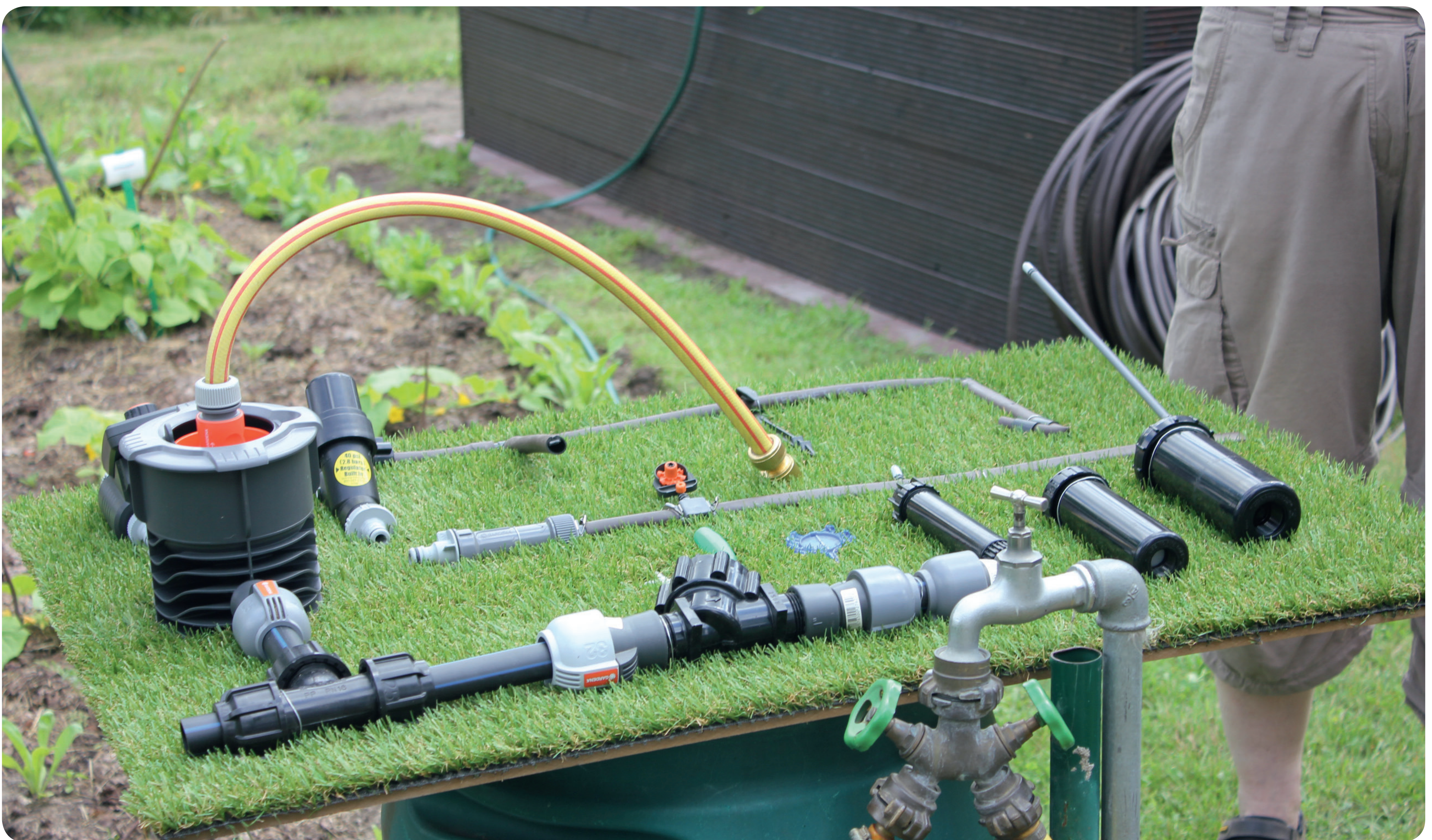
Es gibt eine Vielzahl unter- und oberirdischer Systeme für eine Tröpfchenbewässerung, optional mit Bewässerungsuhr („Schautafel“: Sven Wachtmann.).

Über die Bewässerungsmenge, den Zeitpunkt und die Methoden haben Sie in der Hand, wie viel Wasser bei Ihren Pflanzen ankommt!