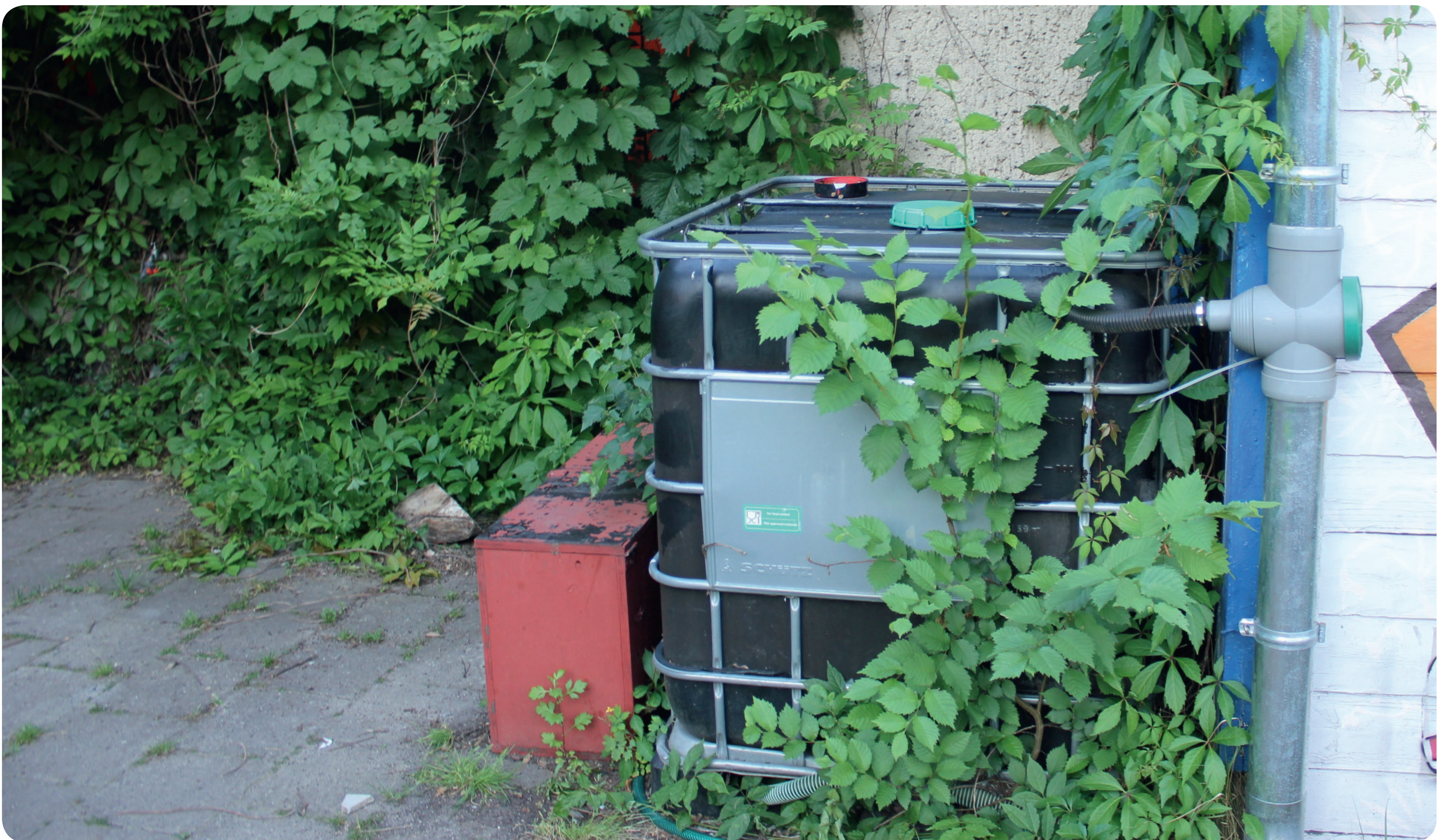
IBC-Tanks fassen 1000 Liter Wasser und können – soweit sie aus der Nahrungsmittelindustrie stammen – als Regenwasserauffanganlage sinnvoll wiederverwendet werden (Foto: Eva Foos, Maxim Kinder- und Jugendkulturzentrum, Berlin).

verbreitet und zweckmäßig. Teiche und Feuchtbiotope als Wassersammelbecken bieten zudem Lebensraum für Pflanzen- und Tierarten . Achtung: Poolwasser mit chemischen Zusätzen muss ordnungsgemäß entsorgt werden, da es sonst das Bodenleben schädigt! Hingegen ist Grauwasser ohne bedenkliche Stoffe wie Natrium, Salz und Tenside als Abwasser viel zu schade . Verwenden Sie es nach einer einfachen Reinigung durch einen Sandfilter wieder zum Gießen!