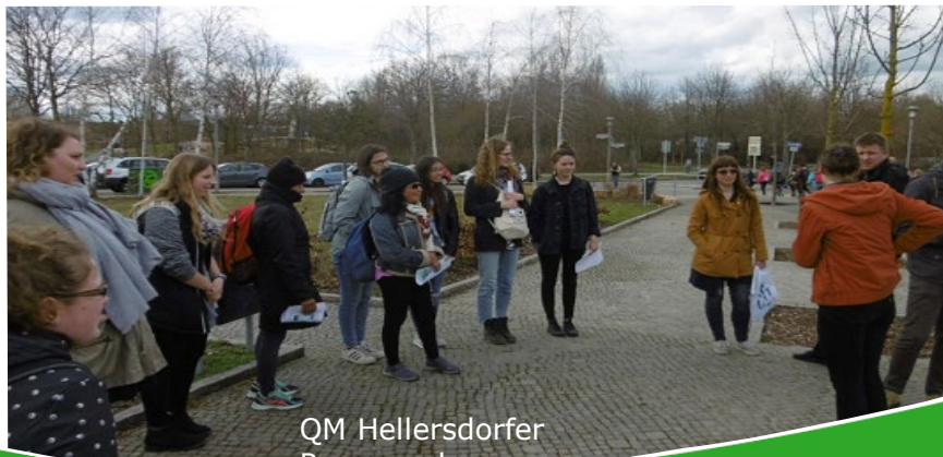
QM Hellersdorfer Promenade