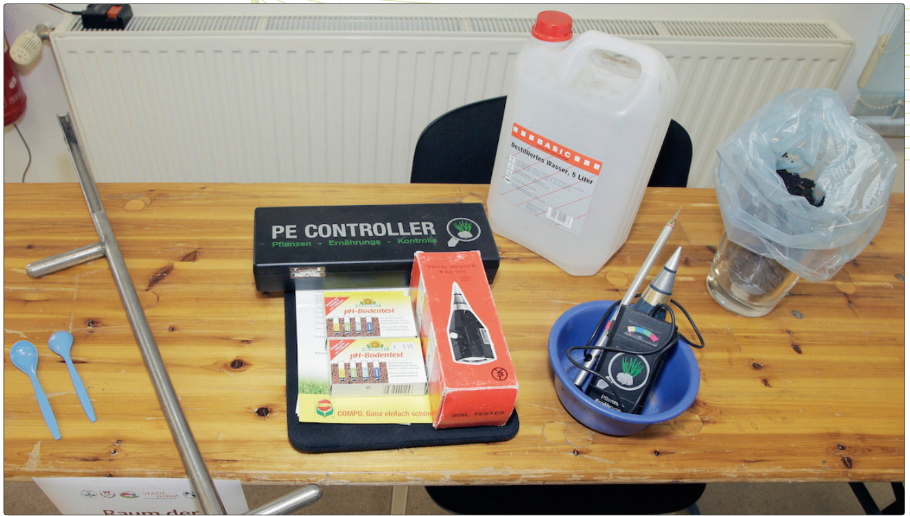
Abbildung 6 Für eine Bodenanalyse benötigte Utensilien: Erdbohrstock, pH-Wert- und Salzgehalt-Messgeräte, destilliertes Wasser sowie ca. 400 Gramm der zu untersuchenden Bodenprobe.