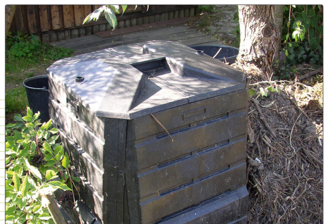
Abbildung 2 und 3 Kompost-Miete (2) und Komposter (3) im Garten an einem schattigen Standort.