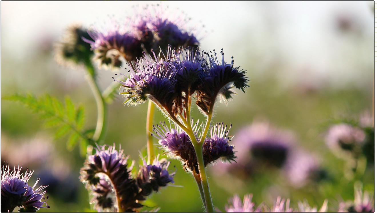
Abbildung 4 Phacelia ist eine hervorragende Gründüngung und gleichzeitig, wie ihr umgangssprachlicher Name sagt, eine „Bienenweide“.

peratur stabil zu halten. Zudem verringert die Bodenbedeckung den Aufwuchs unerwünschter Beikräuter.