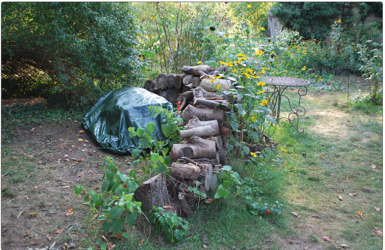
Abbildung 5 Heißkompost im Garten.

Wer Zeit, Arbeit und Platz sparen möchte, kann mit seinen gesammelten Garten- und Küchenresten auch einen Heißkompost aufsetzen. Für die Erzeugung der notwendigen Hitze benötigt man einen Kubikmeter organischen Materials. Auch auf die Schichtung kommt es an. Ein Umsetzen ist bei dieser Kompostierung nicht nötig. Ein gelungener Heißkompost ist bereits nach 3-6 Monaten fertig und ist frei von Unkrautsamen und Krankheitskeimen.