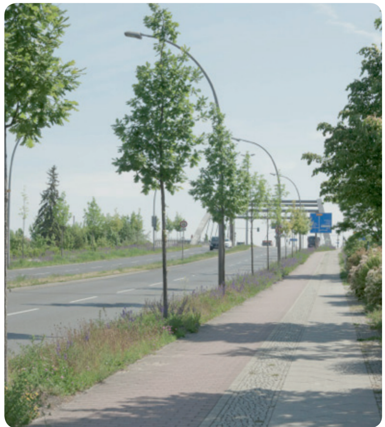
Alleebaumversuch am Extremstandort Neue Späthstraße