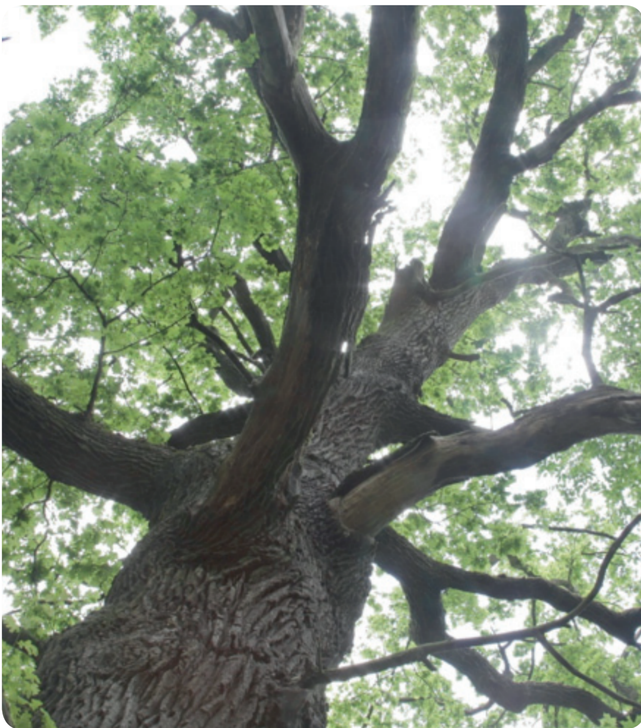
Alte Eiche, Stadtbaum in Berlin Marzahn-Hellersdorf

Auch wir können beitragen und in Hitzesommern die Straßenbäume in unserer Nachbarschaft mit zwei bis drei Eimern Wasser pro Tag und Baum vor dem Vertrocknen bewahren!