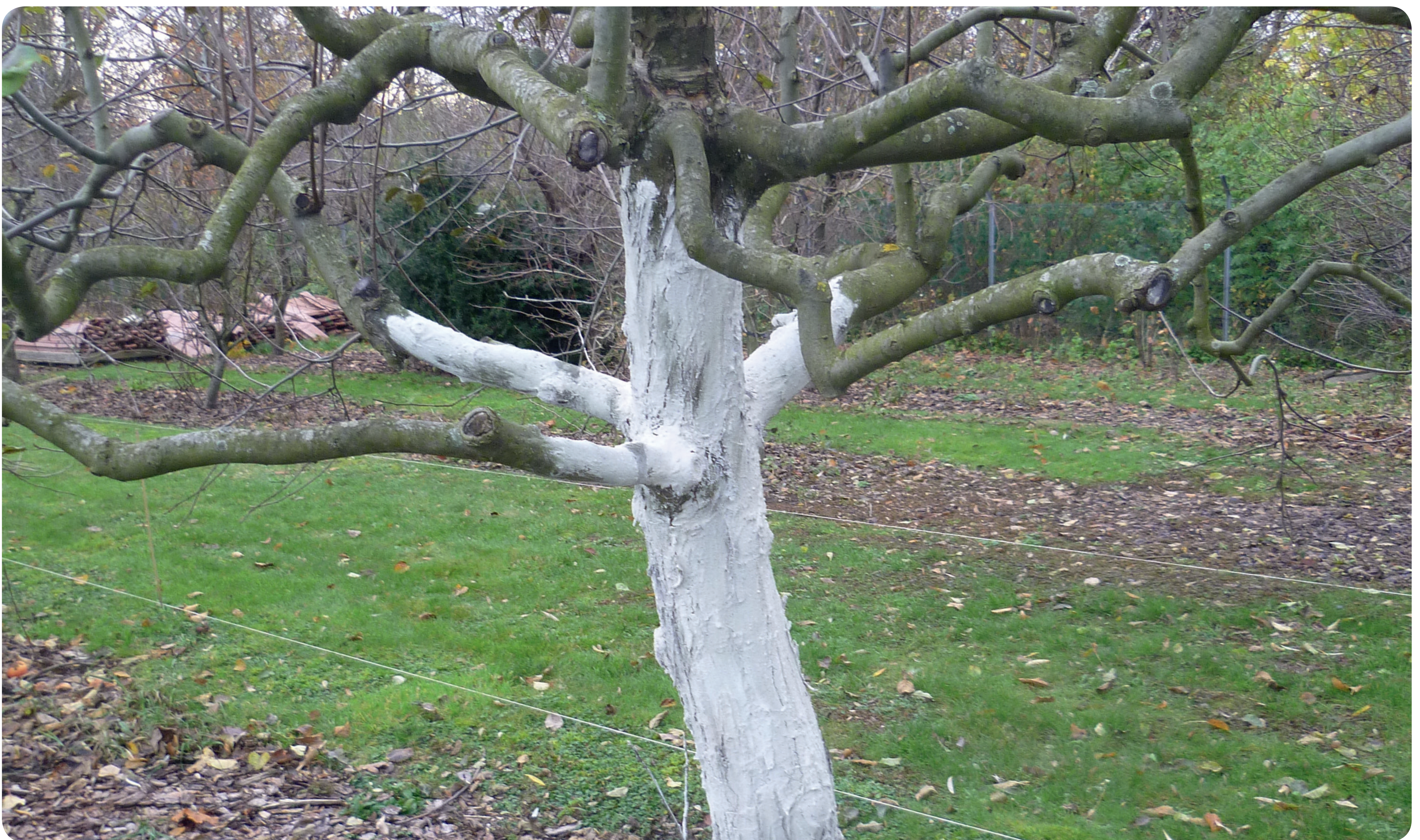
Kalken von Obstgehölzen als Schutzmaßnahme gegen Sonnenbrand (Foto: Pflanzenschutzamt Berlin).

Das Naturprodukt Kalk können Sie beispielsweise im Gartenmarkt erwerben und damit Ihre Obstbäume gut auf den Winter vorbereiten.