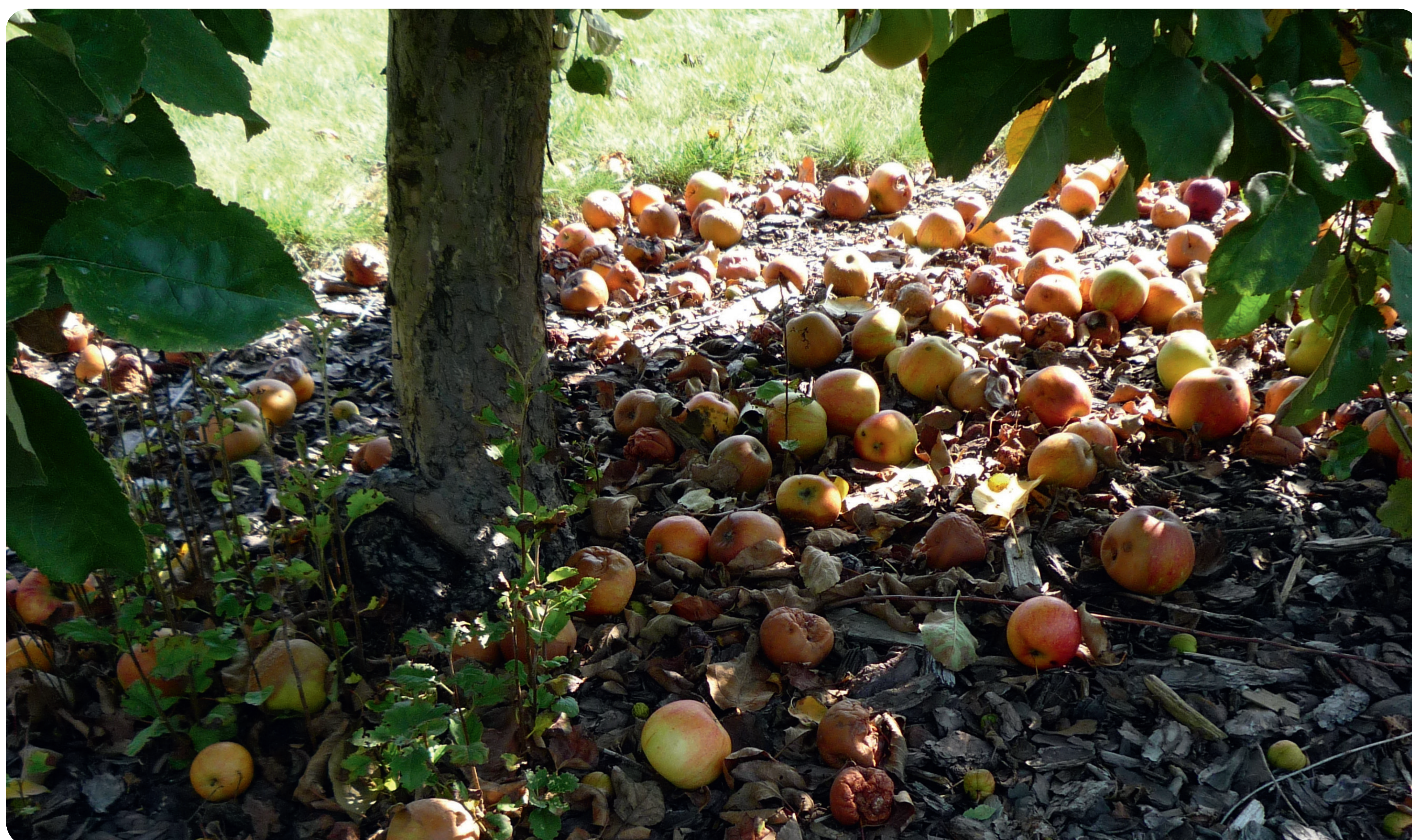
Hier fault das Fallobst. Sammeln Sie es frühzeitig auf, um die Verbreitung der Fruchtfäule zu verhindern!

Bei Fragen wenden Sie sich an das Pflanzenschutzamt und die Gartenfachberatung!