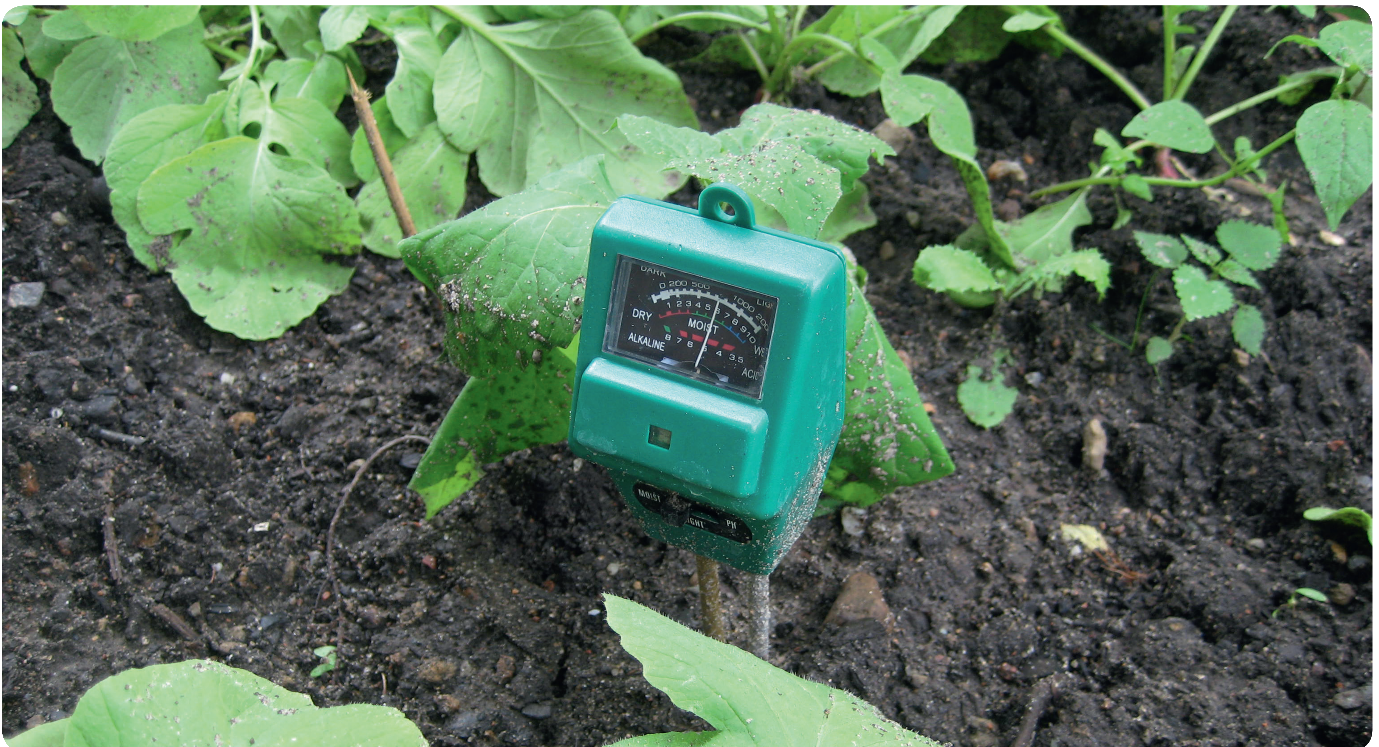
Ein Feuchtemesser (Tensiometer) misst die Saugspannung in Wurzeltiefe und somit die Verfügbarkeit des Bodenwassers für die Pflanzen (Foto: Eva Foos).

Der Deutsche Wetterdienst gibt auf seiner Webseite ortsspezifische, tagesgenaue Bewässerungsempfehlungen: http://www.dwd.de/DE/fachnutzer/freizeitgaertner/_node.html